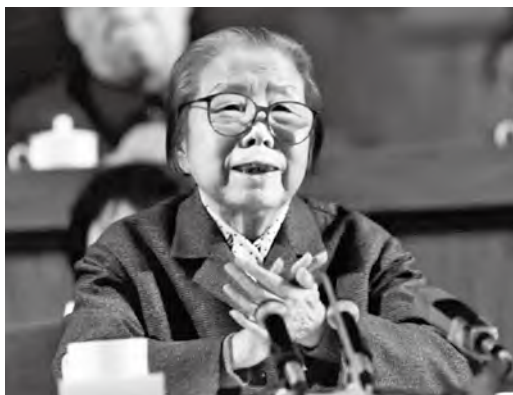
1983年6月，邓颖超在六届政协一次会议上

周恩来逝世后，邓颖超虽然年事已高，但她服从党的决定和人民的需要，毅然走上了党和国家的重要领导岗位。“春天的后面不是秋，何必为年龄发愁……人民的事业与世长久，谁的生命与它结合，白发就上不了他的头。”这是邓颖超喜爱的诗句，也是她晚年精神风貌的生动写照。